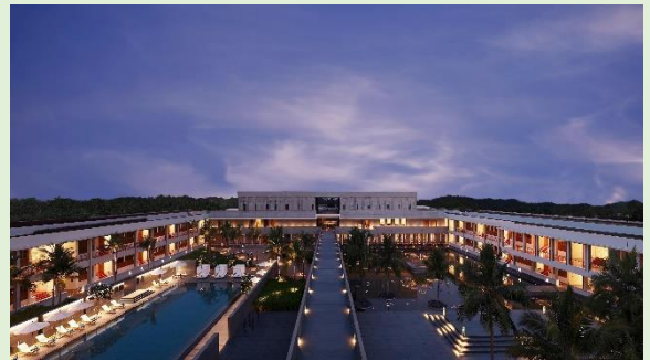
馬哈巴利普蘭 Intercontinental Hotel