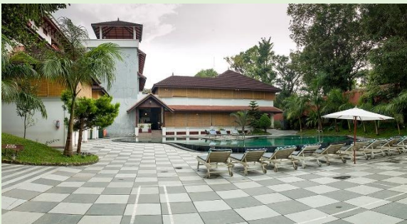
沛綠雅 PERIYA 連泊 2 晚 Elephant Court Hotel 或同級