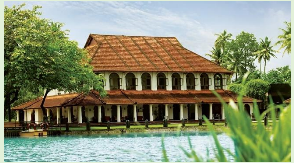
庫瑪拉孔 1 晚 TAJ KUMARAKHOM