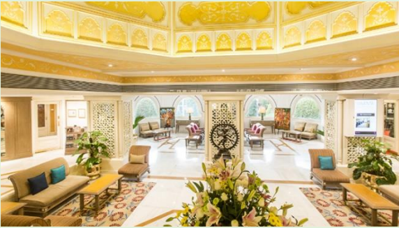
奧蘭卡巴 連泊 2 晚 TAJ VIVANTA PRESIDENT