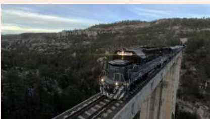
奇瓦瓦太平洋鐵道頭等艙 穿越銅礦峽谷