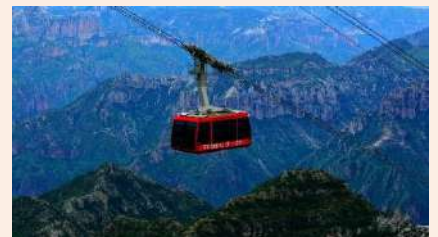
搭乘纜車飛越峽谷 身臨其境感受震撼景致