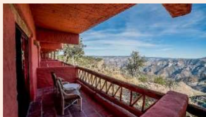
入住五星景觀酒店 飽覽峽谷壯麗美景